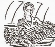
Nursery, sod, Greenhouse/ semillero césped, o invernadero

Name of Parents / Nombres de los padres _____