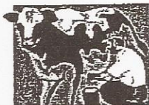
Cattle Hay / Vaqueria El Heno Leche granja lechera