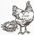
Chicken Poultry Pollos Hueves