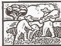
Cultivation, soil preparation/ Cultivo o preparacion del suelo