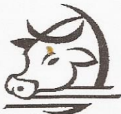
Feed Cattle, processing Or Packing / Procesando Pollo, carne, o puerco

¿Ha trabajado algunos de los trabajos abajo alguien en su familia?