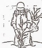
Trees cutting or planting / Arboles cortando o plantando