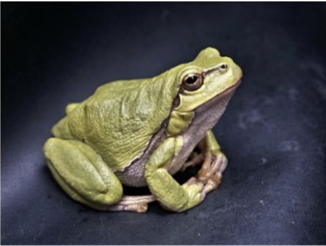
A green frog

¿Las ranas transparentes abrirán el camino para la investigación de las ranas?